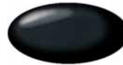
Bluish Black Pearl ZJ3