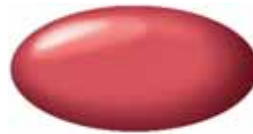
Phoenix Red Pearl ZLB