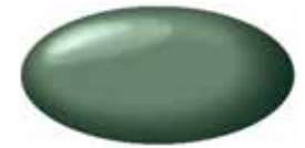
Ever Green Pearl Metallic ZLC