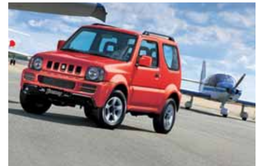
Jimny 1.3 GL TOP