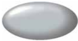
Silky Silver Metallic Z2S