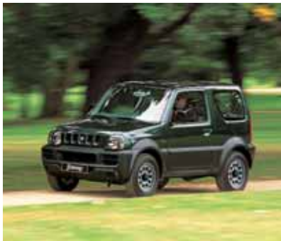
Jimny 1.3 Country