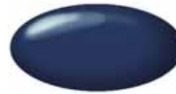
Nocturne Blue Pearl ZJP