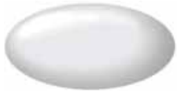
Superior White 26U