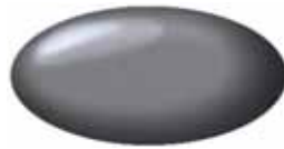
Quasar Grey Metallic ZMA