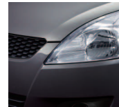
Mineral Gray Metallic (ZMW)