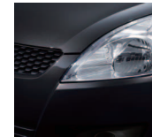
Super Black Pearl (ZMV)