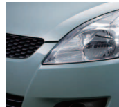
Smoky Green Metallic 2 (ZRL)