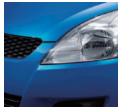
Kashmir Blue Pearl Metallic 2 (ZCG)