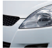
Snow White Pearl (ZMT)