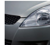
Galactic Gray Metallic (ZCD)