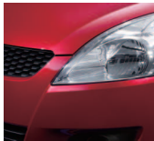
Ablaze Red Pearl 2 (ZRJ)