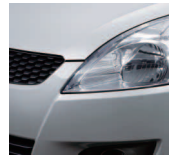
Star Silver Metallic (ZMU)