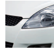
Superior White (26U)