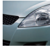
Smoky Green Metallic (ZRM)