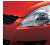
Sunlight Copper Pearl Metallic (ZFS)