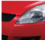
Bright Red 5 (ZCF)